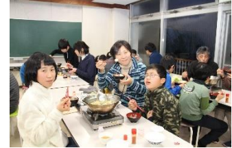
夕食は家族ごとにあったかい鍋