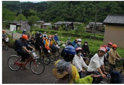
出発 「ゴール目指して出発進行」