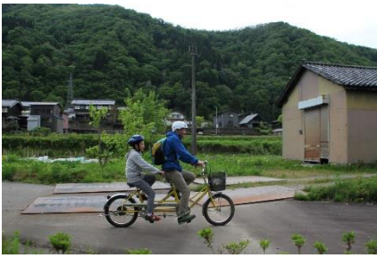
出発前 「息を合わせて2人乗り」