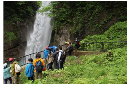
綿ヶ滝 「水量が多くてダイナミック」