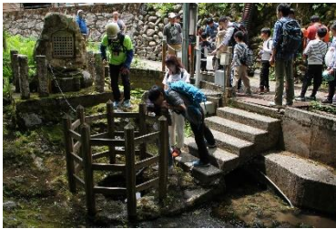
弘法池 「昭和の名水百選、弘法池」