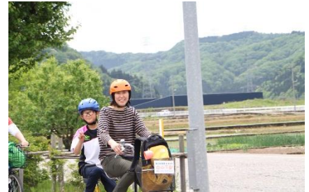
道中 「春風とともに」