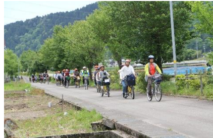
道中 「水と共にたどるキャニオンロード」