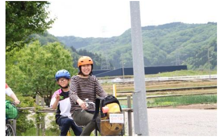
道中 「春風とともに」