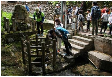
弘法池 「昭和の名水百選、弘法池」