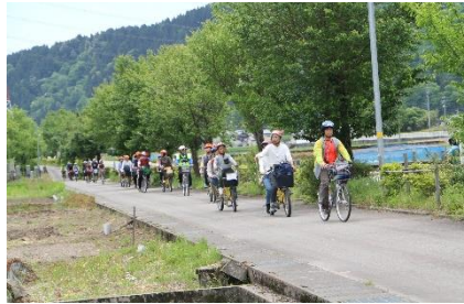
道中 「水と共にたどるキャニオンロード」